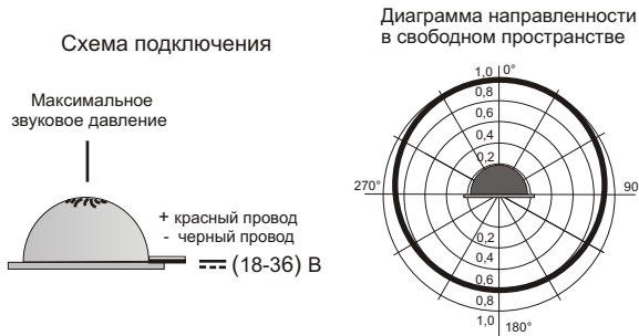
Рис.2 Схема подключения и диаграмма направленности оповещателя.

5.3. На рис.2 показана схема подключения и диаграмма направленности звука оповещателя.