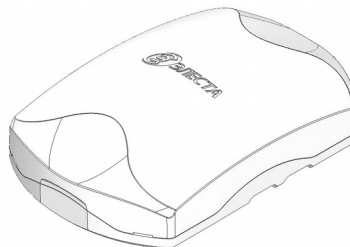
Рисунок 1. Внешний вид прибора

Прибор изготовлен в пластмассовом корпусе (рисунок 1).