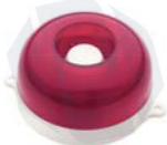
МАЯК-12-КП, МАЯК-24-КП оповещатель комбинированный