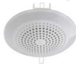
АРИЯ-10 П оповещатель речевой 3Вт/5Вт/10Вт