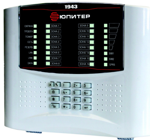
Рисунок 1. Внешний вид прибора «Юпитер-1943»

Прибор предназначен для защиты объектов широкого профиля (от жилых помещений до объектов корпоративных клиентов) путем контроля состояния 16 или 64 зон охраны с подключенными шлейфами сигнализации (ШС) охранных или пожарных извещателей, смонтированных на охраняемом объекте, и передачи сообщений о состоянии прибора на пульт централизованного наблюдения (ПЦН). Прибор изготовлен в пластмассовом корпусе. На крышке пластмассового корпуса расположена индикация и встроенная клавиатура (рисунок 1).